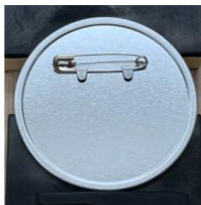
②安全ピンを置きます。