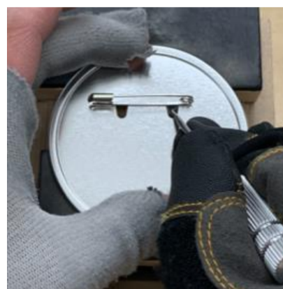
③自打ちを使いピン付けを行います。