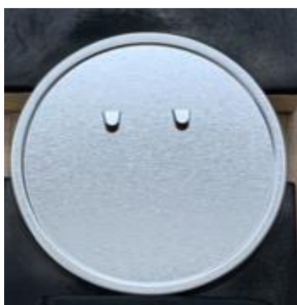
①商品に不良がないか確認します。